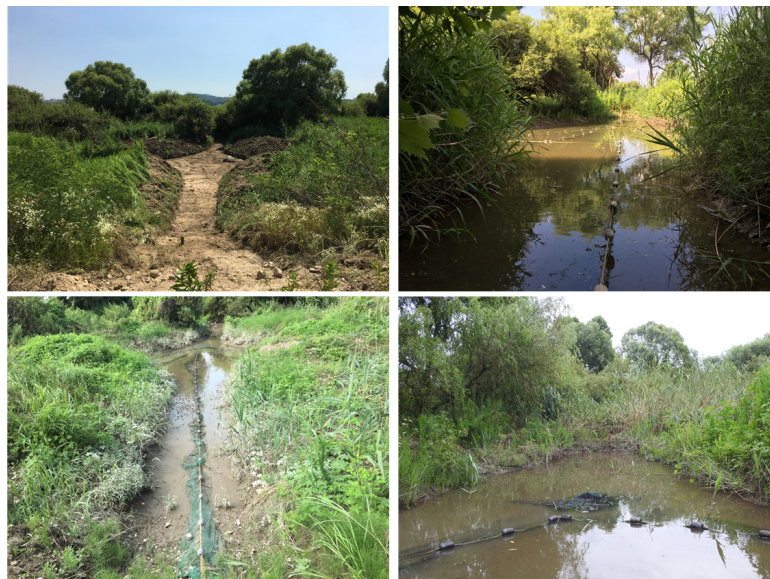
Fig. 2. Construction of Tidal Creeks in Tidal Channels, Janghang Wetland before (left) and after (right)